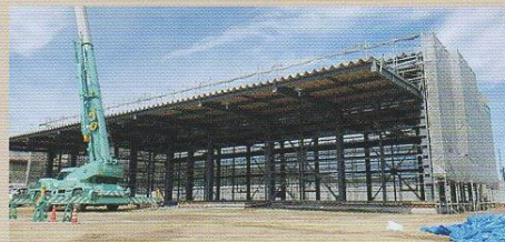
物流センター 新設工事