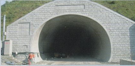
新風吹 トンネル工事