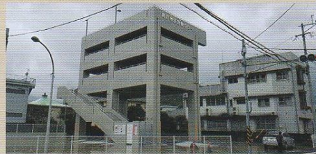
南方地区 津波避難タワー