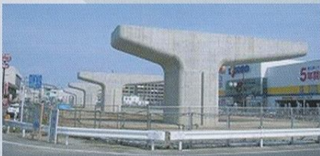
497号拾六町 高架下部工事