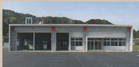
霧島市消防局 準人分遣所